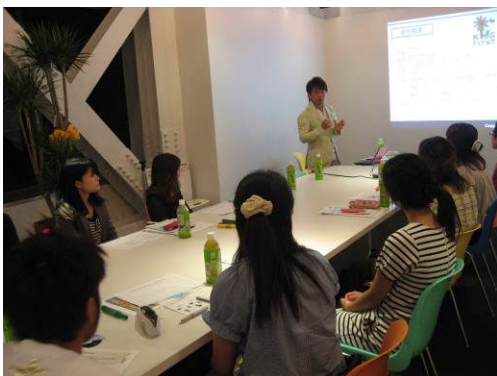
26歳のハローワーク

社会人などの一般向けの学びを提供する新規プログラムを実施した。4プログラムの参加者は、述べ173名におよび、学びの機会から離職防止など社会的孤立の抑止と、より働きがいや生きがい、自信を持てる機会を創出した。なお、当団体として、学生や若年無業者だけではなく新たなユース(若者)層の掘り起こしができた。