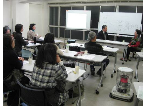
やさしいこころのケア講座

●内閣府「地域社会雇用創造事業グラウンドワークインターンシップ」ブランチ事務局運営 NPO 法人グラウンドワーク三島とパートナーを組み、ソーシャルビジネスに取り組む意欲のある人材の掘り起こしと、栃木県内の実践者の下へインターンシップのコーディネートを行った。本県からは、Ⅲ期生 7名の参加(NPO 関係者 5名、教育関係者 1名、その他 1名)の内、自ら事業を立ち上げた人材が 1名、社会的企業への就職が 1名、NPO で継続的に取り組み続けている人材が 5名となった。NPO や社会的企業などのインターンシップ先は 11 団体となった。