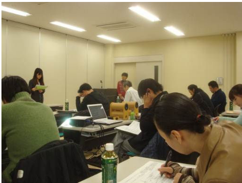
インターンシップ受入れ説明会