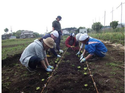
とちぎユースワークカレッジ（農業）