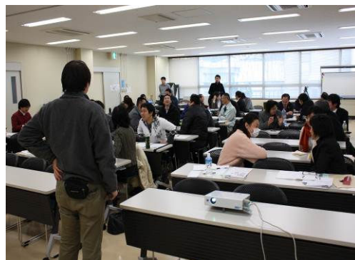
NPOマネジメントフォーラム

多様な社会課題の解決を目指し、NPOのミッションの実現と持続性に必要な「NPOのマネジメント力」を高めるプログラムの開発と運営を行った。当団体のネットワークを活用し、県外の先駆的实践者をゲストに迎え、「NPO マネジメント」に取り組む必要性の普及と取り組む意欲を育むフォーラムを実施。参加者は、40名。次年度は、理事向けと職員向けと2つのコースで“力をつける”プログラムを開催予定。