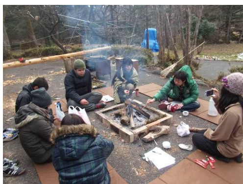
とちぎユースワークカレッジ（環境）

第4期11名、第5期14名の入学者の内、18名が修了し、実施2年半で修了生は延べ104名となった。その内7割が就労やアルバイト、進学、職業訓練など、自らの意識で社会へ一歩踏み出すことができた。修了生が社会参加に繋がったことに加え、以前のような「ひきこもり状態」に戻っておらず、社会参加と社会的孤立の抑止が実現できた。