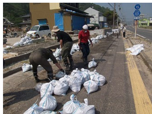
災害ボランティア活動 (いわき市)

2011.03.11 に起こった未曾有の大災害である東日本大震災に対し、他団体の活動への参加という形で支援活動を実施した。(認定NPO法人とちぎボランティアネットワークでの募金活動や事務局業務の補佐、福島県いわき市での災害ボランティア活動など)